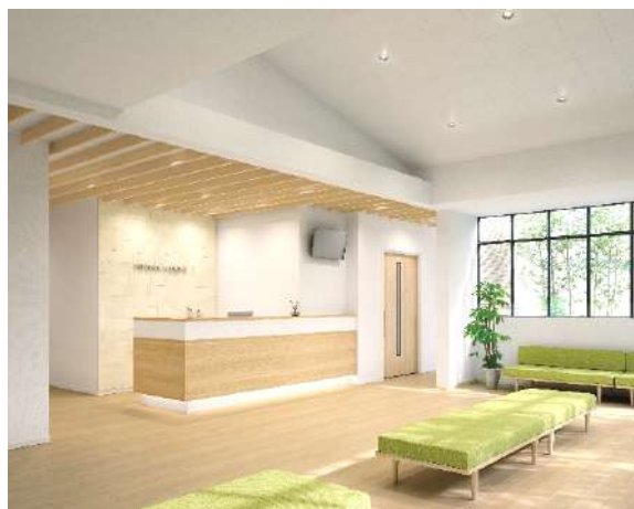
当社製品を採用した、クリニックの空間イメージ

また、製品提案とあわせて、同分野に携わる建築・設計関係者様に向けた情報提供にも注力しており、当社製品の CAD データーの公開をはじめ、会員限定のメール配信サービスや、各種 CPD 認定セミナー等も開催しています。