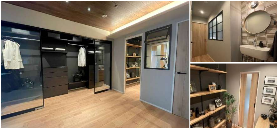
今回リニューアルしたマンションリノベーション空間展示（左:寝室、右上:玄関～廊下、右下:DEN 空間）

なお今回の新展示は、株式会社インテリックス空間設計（東京都目黒区、社長：俊成誠司）協力のもと、展示コンセプトやプラン設計を含めた空間コーディネートを行っております。