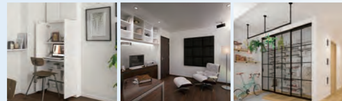
テレワークスペースの設置 音問題の改善 スタイリッシュな空間の実現

リフォーム・リノベーション物件では、トレンドを意識した空間テイストが好まれるとともに、ウィズコロナによる在宅勤務の普及や自宅で過ごす時間の増加といった新たなライフスタイルに合わせて、より便利で快適な空間を実現したいというニーズが高まっています。このような市場のニーズを受けて、人気の高いブラック色を基調に空間をスタイリッシュに演出する製品をはじめ、省施工でのワークスペースの確保や、音漏れ・反響といった音問題の改善などに対応した製品の開発を強化しています。