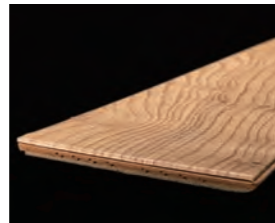
立体感のある張り上がりを実現 (特許取得済)

立体感のある意匠性と機能性に優れた床材として市場より高い評価をいただいている「Trinity (トリニティ)」シリーズのラインアップに、マンションのリフォーム・リノベーション専用の「トリニティオトユカ 45 リフォーム・リノベ専用 (144 幅タイプ)」を追加し、2022 年 10 月より発売いたしました。本製品の基材には、環境配慮・安定調達の観点から、当社が新たに開発したオトユカ用 MDF 基材を使用しています。サステナビリティへ貢献するとともに、より上質で個性豊かな空間が望まれるマンションリノベーション市場に向けた、他社にはない高意匠シート化粧床材として提案を進めています。