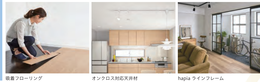
吸着フローリング オングロス対応天井材 hapia ラインフレーム